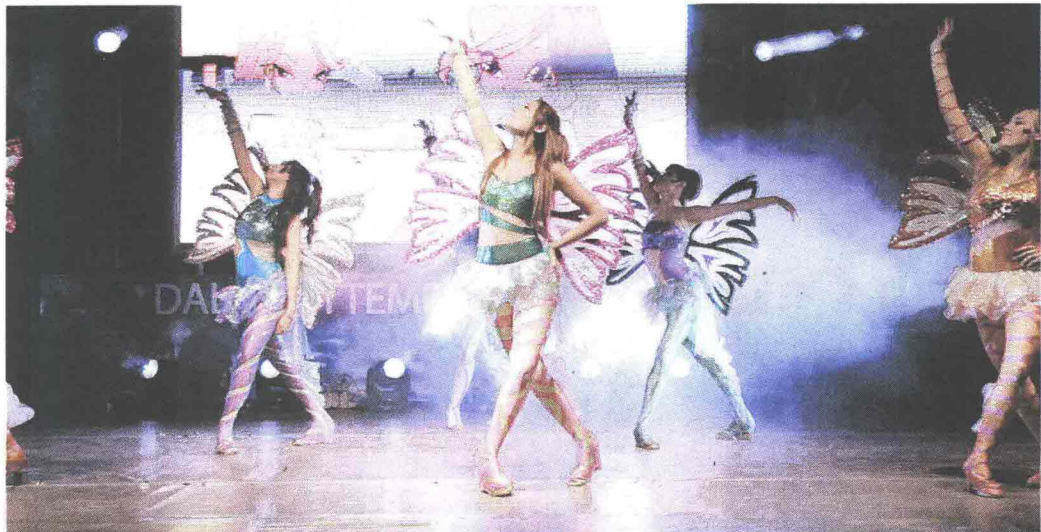
Bloom, Flora, Stella, Aisha, Musa e Tecna: le magiche eroine nello spettacolo "Winx Club Musical Show"